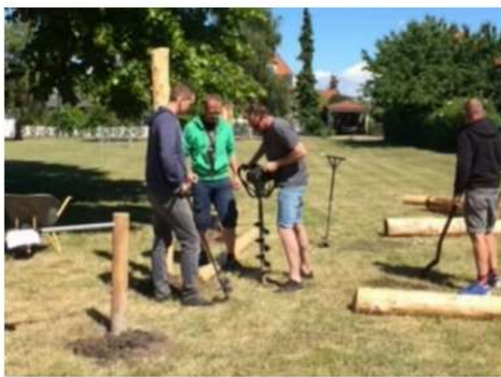
Historiske billeder fra anlægget af vores første legeplads