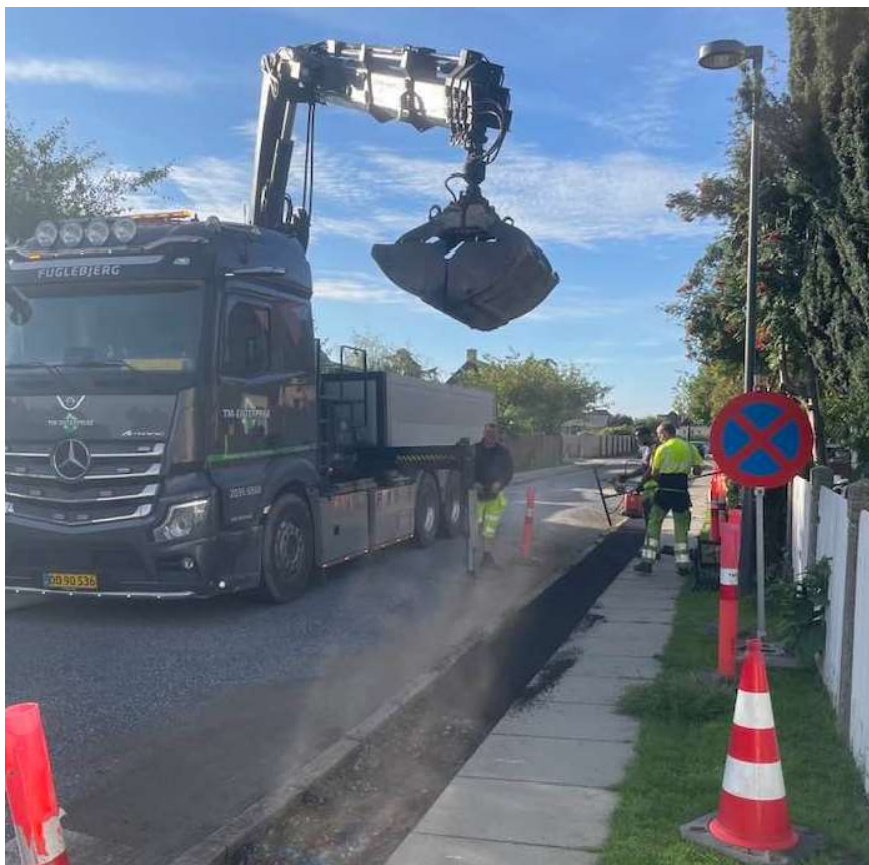
Arbejdet med udskiftning af bræmmer er i fuld gang - August 2023

Der er her i løbet af sommerferieperioden blevet udført en række udbedringer ad vores entreprenør TM Enterprise af primært asfaltbræmmerne i grundejerforeningen.